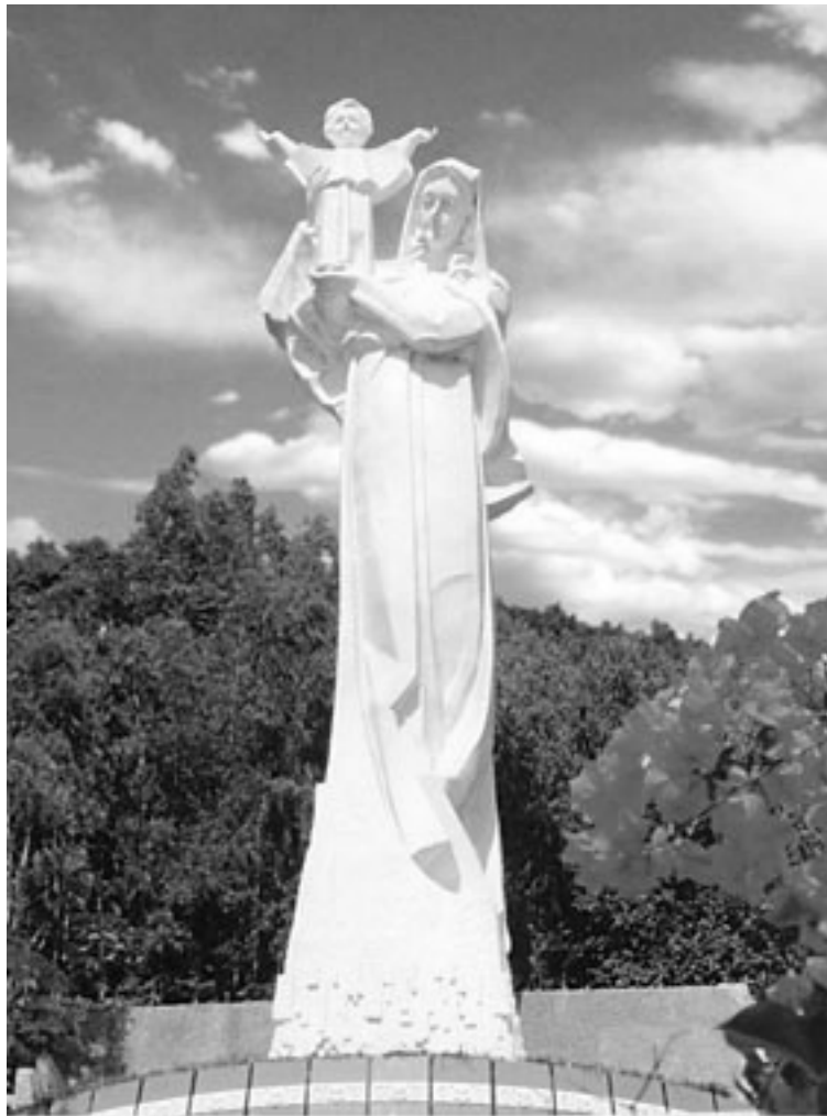
Tượng đài Đức Mẹ Bãi Dâu